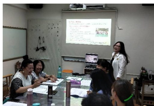
三-(三)辦理家庭教育情緒議題活動 -談孩子人際關係的建立