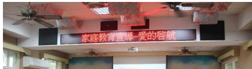
三-(五)利用電子看版宣導家庭教育