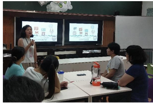
三-(四)辦理性別平等講座