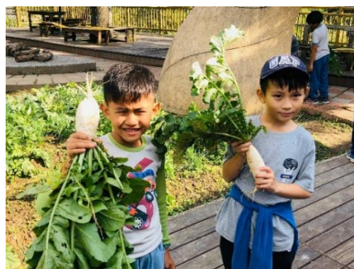
三-(一)辦理親職教育倫理(代間)活動與阿嬤做蘿蔔糕