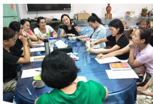
三-(二) 辦理家庭教育 家庭及社會資源議題活動 -為愛朗讀活動