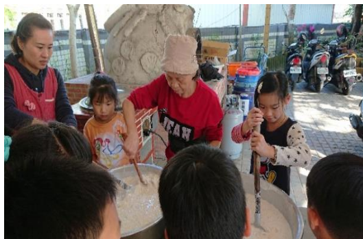
三-(一)辦理親職教育倫理(代間)活動-與阿嬤做蘿蔔糕