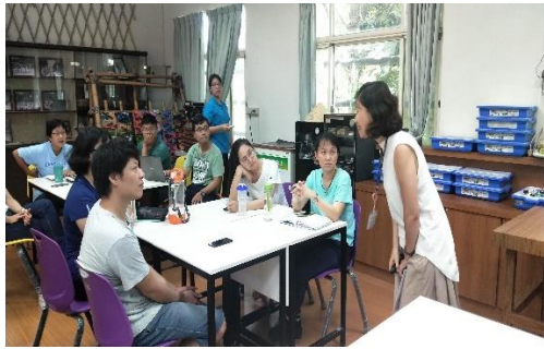
三-(四)辦理性別平等講座