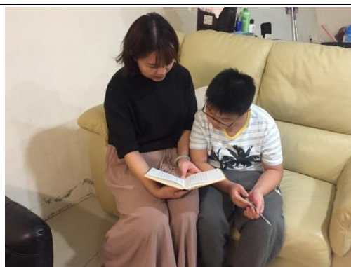
三-(二) 辦理家庭教育 家庭及社會資源議題活動 -為愛朗讀活動